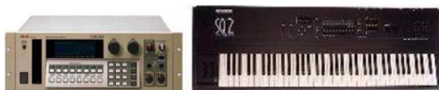
Echantillonneur et son clavier de commande